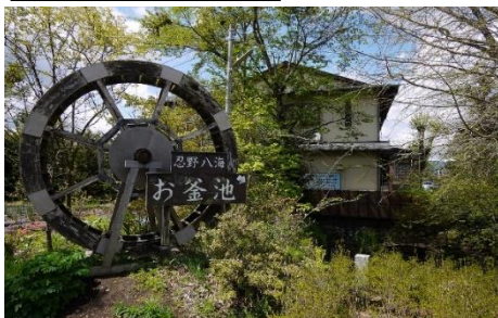
忍野八海 (イメージ)