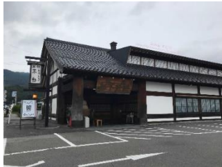
ほうとう不動河口湖北本店 (イメージ)