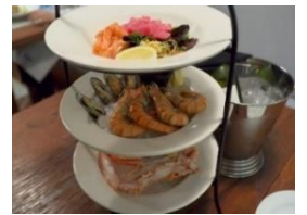
ヒルトン成田・テラスレストランのランチビュッフェ!

<成田山新勝寺> 境内は6万坪、江戸期建立の御堂、美しい公園など見どころいっぱいです。(イ・ジ)