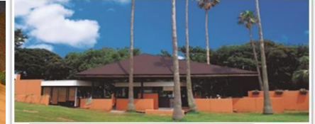
漁師丼、アジアンガーデン。(イ・ジ)