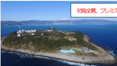
初島全景、プレミア号。(イ・ジ)

【コース】各地7:20~7:50出発=(東名・小田原厚木)=熱海港〜(定期船約30分)〜初島港・・・アジアンガーデン(散策)・・・14店舗ある食堂街で丼クーポンを使って各自でご昼食・・・初島港〜(定期船)〜熱海港=小田原さかなセンター=(西相・小田原厚木・東名)=各地18:00~18:30到着予定