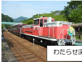
わたらせ渓谷鉄道・トロッコ