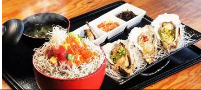
早川漁港「海舟」の海鮮タワー丼

【コース】各地 8:30~9:00=(東名・小田厚道)=小田原鈴廣かまぼこの里(工場見学・買い物)=小田原早川漁港(海鮮丼の昼食)=新江ノ島水族館・・・江ノ島散策=鎌倉ハム(買い物)=各地 17:30~18:00