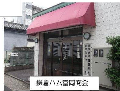
鎌倉ハム富岡商会