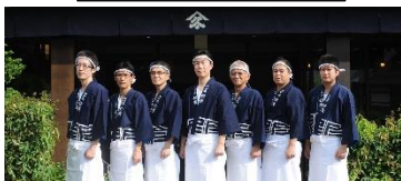
鈴廣かまぼこの里

【コース】各地 8:30~9:00=(東名・小田厚道)=小田原鈴廣かまぼこの里(工場見学・買い物)=小田原早川漁港(海鮮丼の昼食)=新江ノ島水族館・・・江ノ島散策=鎌倉ハム(買い物)=各地 17:30~18:00