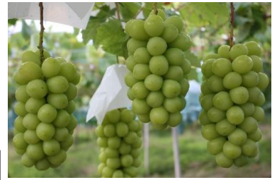
勝沼「一古園」にてシャインマスカット一房狩りと3種の冷たいぶどう皿盛り！