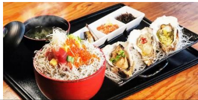
早川漁港「海舟」の海鮮タワー丼