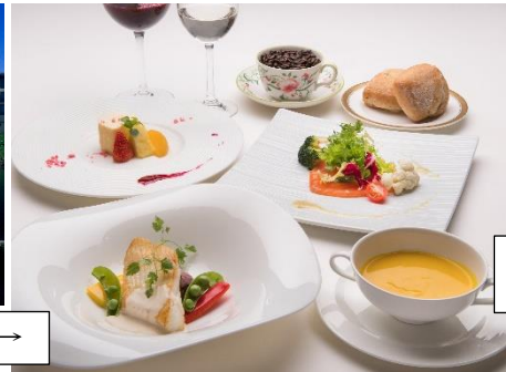
「まきばレストラン」でミニソフトクリーム